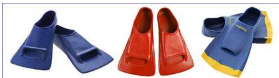
Слева направо: Ласты Original Zoomers Fins от FINIS (стайер и спринт) и Training-Finz от Hydro

Ласты Original Zoomers Fins от FINIS и Training-Finz от Hydro . Первые ласты, специально созданные для спортивного плавания. Делятся на спринтерские (более жесткие) и стайерские (они мягче).