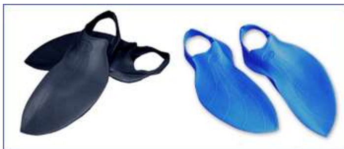
Ласты Alpha от Aqua Sphere

2. Тренировочные ласты стандартного размера – длина лопасти приблизительно равна длине стопы, ширина в 1,5 раза больше ширины стопы.