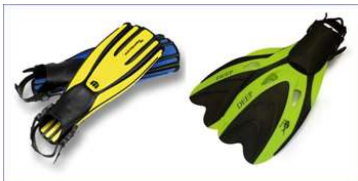
Ласты с открытой пяткой

Лопасть ласт имеет жесткое сочленение с башмаком. Помогают преодолеть сопротивление, создаваемое снаряжением, эффективны при плавании против течения.