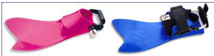
Ласты Slim от Force fin

Ласты Slim от Force fin . Имеют тонкую и мягкую лопасть. Обладают качествами Zoomers и Стандартных ласт. Для любительских непродолжительных тренировок.