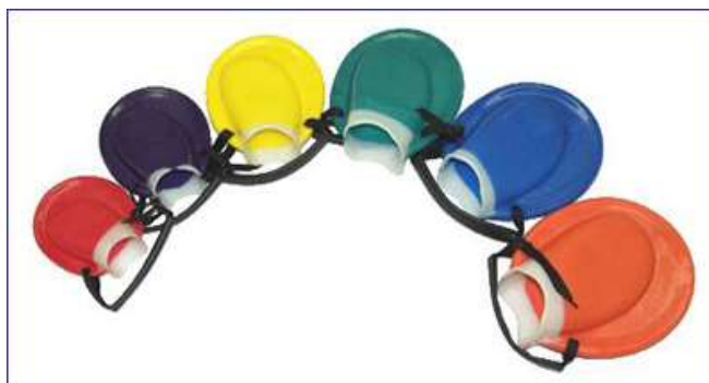
Ласты Positive Drive Training Fins от Tritan

Ласты Original Zoomers Fins от FINIS и Training-Finz от Hydro . Первые ласты, специально созданные для спортивного плавания. Делятся на спринтерские (более жесткие) и стайерские (они мягче).