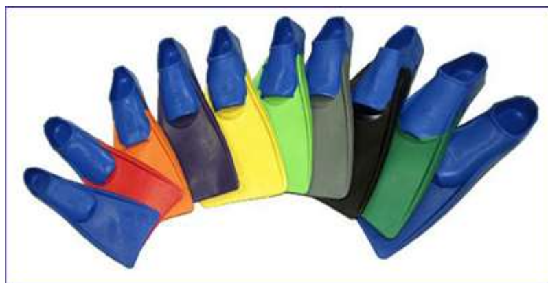
Линейка тренировочные ласт стандартного размера Full-Foot Pocket Swim Fins от Tritan

2. Тренировочные ласты стандартного размера – длина лопасти приблизительно равна длине стопы, ширина в 1,5 раза больше ширины стопы.