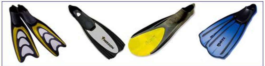
Широкие гибкие резинопластиковые ласты

Ласты сделаны из комбинации материалов: ножной карман - из резины, лопасть – термопластика и резины. Имеют специальную конструкцию, позволяют преодолевать большие расстояния не уставая.