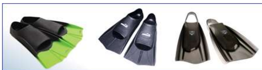
Короткие тренировочные ласты

Идеальны для совершенствования кроля на груди и кроля на спине. Короткие ласты позволяют пловцу сохранять примерно ту же скорость, что и при плавании без ласт. Но при этом такие ласты добавляют площадь ступням, позволяя создавать более мощные движения. Эти ласты не сильно нагружают суставы. Ласты, изготовленные из твердых материалов, позволяют еще больше увеличить толчок ногами. Но такие ласты сильнее влияют на суставы и мышцы. Короткие ласты можно использовать для обучения волнообразным движениям в бросе и плавания баттерфляем (дельфином).