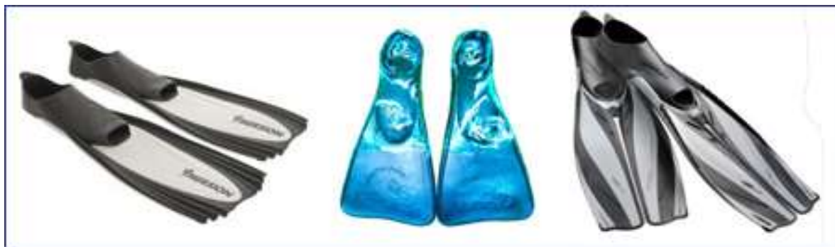
Ласты с закрытой пяткой