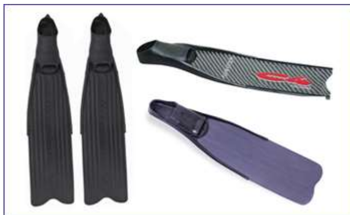
Длинные узкие скоростные ласты

Очень длинные и узкие лопасти. Высокая скорость, но не лучшая маневренность. Для спортивного скоростного подводного плавания.