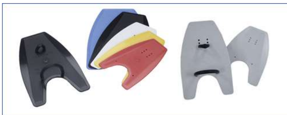
Лопатки Fulcrum Hand paddles

Эти лопатки были специально разработаны для того, чтобы предотвратить травмы плечевых и локтевых суставов. Но, если такие лопатки чересчур большие, это не убережет суставы от перегрузки. Поэтому так важно выбрать правильный размер. Правильно подобранные лопатки Fulcrum Hand paddles имеют перед другими видами лопаток только одно преимущество: вектор силы начинается близко от петли на запястье, что уменьшает напряжение в сухожилиях мышц пальцев и запястья.