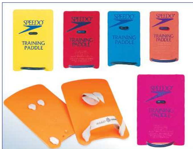
Классические прямоугольные лопатки разного размера

Эти лопатки прямоугольной формы появились одними из первых и до сих пор являются одной из самых используемых моделей. Лопатки прямоугольной формы сильно увеличивают сопротивление за счет своей не обтекаемой формы. Для максимального эффекта нужно снять ремешок, крепящий лопатку к запястью.