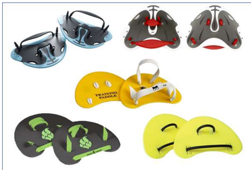
Лопатки для пальцев рук

стороне плечевых суставов. Это может привести к воспалению сухожилий (так называемый "теннисный" локоть) у особо чувствительных. В данном случае может быть полезной растяжка мышц пальцев рук. У пальцевых лопаток, как и у обыкновенных, можно снять ремешок, надевающийся на ладонь.