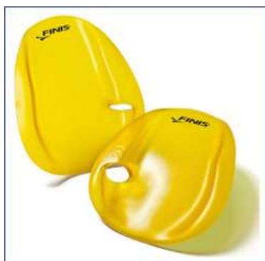
Лопатки FINIS Agility Paddles

6. Лопатки без ремешков Agility Paddles от FINIS. Эти лопатки имеют передовой эргономичный дизайн. Отсутствуют ремешки-фиксаторы. Выпуклая форма лопаток и отверстие для большого пальца позволяют кисти принять естественное положение с очень небольшим давлением на пальцы. Лопатки немного увеличивают рабочую площадь ладоней, но не настолько, чтобы получить травму (правильно выбирайте один из трех выпускаемых размеров). Предназначены для формирования правильной техники гребка, ориентированы на пловцов среднего уровня и продвинутых. При плавании в этих лопатках необходимо держать определенным образом запястье и предплечье. При использовании неправильной техники лопатки спадают с рук. Лопатки подходят для оттачивания техники стилей кроль на груди и спине, брасс, баттерфляй.