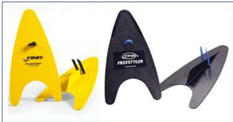
Лопатки FINIS Freestyler

Эти лопатки специально созданы для плавания кролем на груди. В них используется запатентованная скег-технология, которая вынуждает пловца максимально вытягивать руку и обучает вращению кисти вначале гребка. Лопатки Finish имеют клиновидную форму (широкие у запястья и постепенно сужающиеся к кончикам пальцев). Такие лопатки меньше нагружают локтевые суставы, при условии правильного подбора размера.