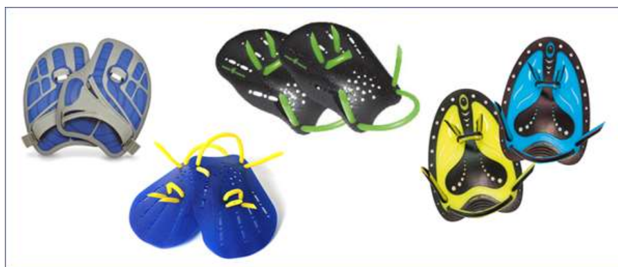
Лопатки анатомической формы

Эта модель лопаток, пожалуй, самая популярная. Анатомическая форма лопаток обеспечивает хорошее «сцепление» с ладонью. Используются как тренажер для отработки правильной техники плавания, а также для развития силы и скорости. Для максимального эффекта нужно снять ремешок, крепящий лопатку к запястью.